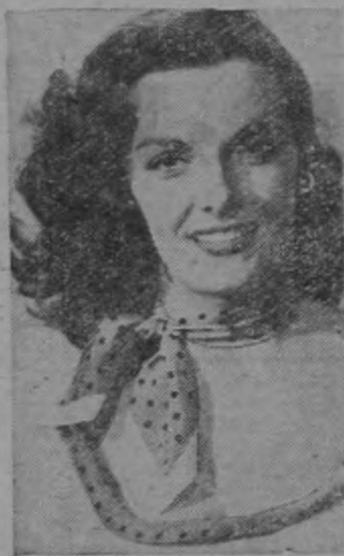
JANE RUSSELL — quien aparece en la película "Bella y Bandida" de la R.K.O.